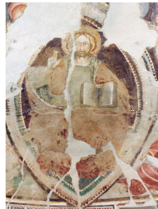
La Majestas Domini (sec. XV) nel catino absidale di Santa Margherita

La leggenda vuole che la fanciulla fosse originaria di Antiochia, figlia di un certo Edesimo, prete pagano. Orfana di madre, fu affidata ad una nutrice cristiana che viveva in campagna e che la convertì al cristianesimo. All'età di quindici anni (si era all'epoca delle persecuzioni di Diocleziano e Massimiano), mentre un giorno, assieme ad altre fanciulle accudiva al gregge di pecore della sua nutrice, Margherita fu vista da Olibrio, governatore della provincia, che viaggiava verso Antiochia. Questi, folgorato dalla bellezza della giovinetta, volle prenderla in moglie, convertendola alla fede pagana. Nonostante le più allettanti promesse, seguite da terribili minacce, la fanciulla rifiutò, non volendo abiurare alla propria fede. Olibrio la fece quindi sottoporre a feroci torture, la fece gettare in una oscura prigione ove le comparve il demonio in sembianze mostruose; Margherita se ne liberò con un gesto di croce. Vinto il demonio, la martire fu nuovamente tentata all'abiura dal governatore ma, essendosi rifiutata, fu sottoposta a nuovi tormenti. Da questi supplizi Margherita uscì indenne, grazie anche alla presenza dello Spirito Santo che la fanciulla aveva invocato onde fortificarla. Molti pagani che assistevano a tale prodigio credettero nel messaggio cristiano e si convertirono sì che, a punizione della loro abiura, furono fatti immediatamente giustiziare. Alla fine, anche la santa fu decapitata.